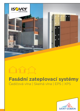
Detailní popis aplikace výrobku je uveden v katalogu ISOVER Fasádní zateplovací systémy

4. 7. 2019 Uvedené informace jsou platné v době vydání technického listu. Výrobce si vyhrazuje právo tyto údaje měnit.