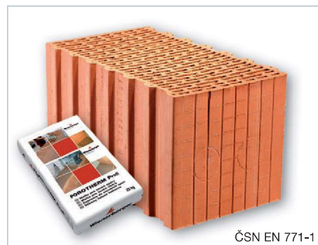
ČSN EN 771-1

Cihly Porotherm 44 Profi jsou dodávány zafóliované na vratných paletách rozměrů 1340 x 1000 mm. - počet cihel 60 ks/pal - hmotnost palety max. 1255 kg Součástí dodávky je odpovídající množství malty pro tenké spáry Porotherm Profi . Pro založení stěn se dodává požadované množství základací malty Porotherm Profi AM (Anlegemörtel).